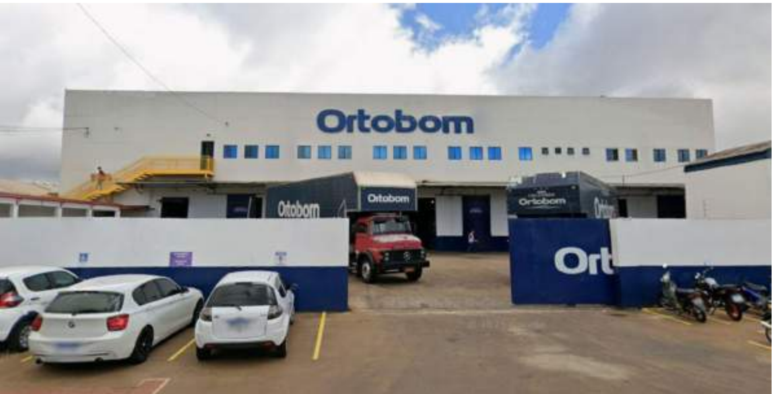
Fábrica da Ortobom em Arapongas (PR)